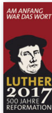
Abb. 10 Das offizielle Logo des Reformationsjubiläums 2017 in den Farben Schwarz-Rot-Gold

Gegenläufig zu der allgemeinen Tendenz aller maßgeblichen Jubiläumsakteure, Luthers Person ›einzuhegen‹ und in das europäische Gesamtereignis ›Reformation‹ zu integrieren, stand seine Person bei den literarischen Neuerscheinungen der Jubiläumsjahre im Vordergrund. Nachdem die bereits einige Jahre zuvor erschienene große Lutherbiographie Heinz Schillings, 32 die insbesondere die politischen Dimensionen seines Wirkens akzentuiert hatte, zunächst den deutschen, bald auch den internationalen Buchmarkt erobert hatte, wurden die übrigen ursprünglich deutschsprachigen Lutherbiographien im Zusammenhang mit dem Jubiläum vornehmlich von fachlich nicht ausgewiesenen Literaten und Journalisten abgefasst. 33 Dass diese Jubiläumsephemeren ähnlich schnell im modernen Antiquariat verschwinden werden wie die meisten von ihnen geschrieben wurden, liegt auf der Hand. Der sogleich nach ihrer englischen Originalausgabe ins Deutsche übersetzten Lutherbiographie (Abb. 11) der Oxforder Historikerin Lyndal Roper 34 allerdings gelang es, größere Aufmerksamkeit auf sich zu ziehen. Gewiss spielte dabei zunächst eine Rolle, dass sie die erste Lutherbiographin