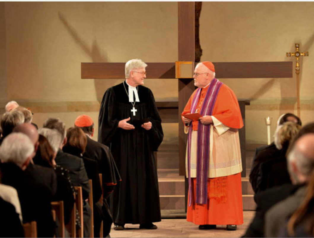
Abb. 12 Heinrich Bedford-Strohm, Ratsvorsitzender der EKD und Kardinal Reinhard Marx, Vorsitzender der Katholischen Deutschen Bischofskonferenz, beim Versöhnungsgottesdienst am 11.3.2017 in der Michaeliskirche Hildesheim

Augustinermönchs würdigte, 47 wurde allgemein als recht dürftiges Hoffnungszeichen gewertet. Im Zuge des Pontifikatswechsels und neuer personeller Konstellationen in der EKD und an der Spitze der Deutschen Bischofskonferenz intensivierten sich dann die Annäherungen zwischen den deutschen Kirchenleitungen. In einem Briefwechsel 48 verständigten sich Landesbischof Bedford-Strohm und Kardinal Marx darauf, das Reformationsjubiläum als »Christusfest« zu feiern – als ob nicht jedes christliche Fest ein solches ist! – und eine Reihe gemeinsamer Veranstaltungen durchzuführen. Insbesondere eine »Pilgerfahrt nach Israel« von Vertretern der Deutschen Bischofskonferenz und des Rates der EKD, eine von Marx sekundierte Audienz bei Franciscus I. für den Rat der EKD und ein als Kernelement eines »healing-of-memory-Prozesses« inszenierter Versöhnungsgottesdienst in Hildesheim sorgten für größere öffentliche Aufmerksamkeit.