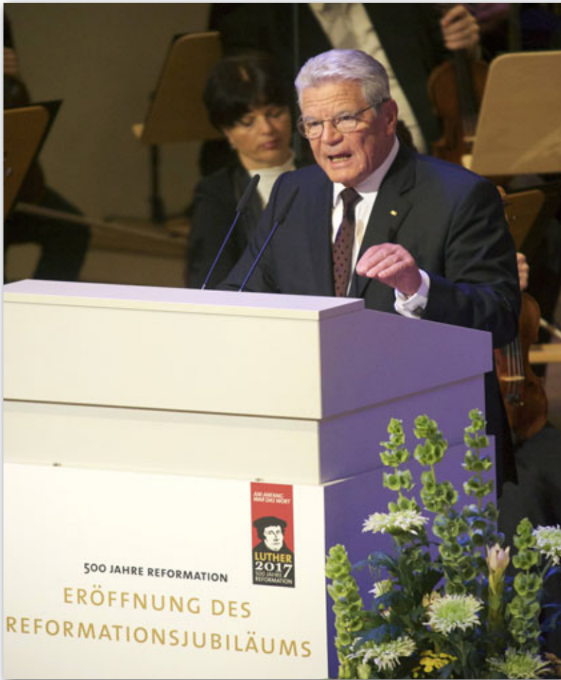
Abb. 7 Bundespräsident Joachim Gauck während seiner Rede zur feierlichen Eröffnung des Jubi- läumsjahres am 31.10.2016 im Konzerthaus am Berliner Gendar- menmarkt

Bundespräsident Joachim Gauck (Abb. 7) ging mit der identitätspolitischen Funktion des Reformationsjubiläums freilich unverhohlen um. Luther habe die Tür zu einem neuen Verständnis der Freiheit aufgetan und dadurch grundlegende Wandlungsprozesse in Gesellschaft und Politik angestoßen, die in ihrer Dynamik allerdings weit über ihn hinausgingen. 23 In verschiedenen Politikerreden wurde vor allem der bildungsgeschichtliche Impuls der