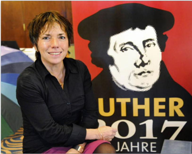
Abb. 3 Margot Käßmann als Botschafterin für das Reformationsjubi- läum am 06.11.2012 am Stand zum Sy- nodenschwerpunkt- thema Reformation bei der EKD-Synoden- tagung im Ostseebad Timmendorfer Strand

Nachdem Margot Käßmann infolge ihres unerwarteten Ausscheidens aus den Ämtern der Hannoverschen Landesbischöfin und der Ratsvorsitzenden der EKD (2010) im Jahre 2012 das neu geschaffene Amt einer »Reformationsbotschafterin« (Abb. 3) übertragen wurde – gewiss auch in der Absicht, sie institutionell einzubinden und kirchenpolitisch zu neutralisieren –, erhielt das 500. Reformationsjubiläum ein profiliertes und medial sehr prominentes ›Gesicht‹. Käßmanns rastloses Engagement trug in den kommenden Jahren entscheidend dazu bei, dass die mediale Aufmerksamkeit für das Jubiläum und die besonders durch ihre Person repräsentierten gesellschaftspolitischen und sozialetischen Themen, deren inhaltliche Verbindung zum historischen Ereignis ›Reformation‹ keineswegs immer klar war, gesteigert wurde. Eine Integration der »Reformationsbotschafterin« in das sukzessiv aufgebaute komplexe kirchlich-staatliche Gremien- und Institutionengefüge war seitens der Verantwortlichen offenbar nicht erwünscht. Insofern agierte sie über weite Strecken als Solitär.