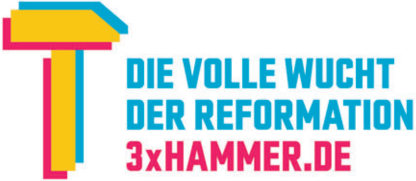
Abb. 4 Das Motiv der Dach- kampagne der drei Nationalen Sonder- ausstellungen in Berlin, Wittenberg und Eisenach »3xHammer«

den (Abb. 4), waren ihm nicht zuletzt wegen des dissimulierenden, klare Beschlusslagen unterlaufenden Verhaltens seines Vorsitzenden verwehrt. 11 Die gesamte Gremienkonstruktion des Reformationsjubiläums war nicht dazu angetan, eine institutionalisierte Kommunikation zwischen Entscheidungsträgern und wissenschaftlichen Experten zustande zu bringen, wie sie für die Tätigkeit ›wissenschaftlicher Beiräte‹ gemeinhin als charakteristisch gilt. Gegen Ende seiner Amtszeit suchte sich der Wissenschaftliche Beirat eigene wissenschaftlich-publizistische Aufgaben, denen allerdings, wie es scheint, eine größere Wirkung außerhalb der einschlägigen Fachkreise versagt blieb. 12