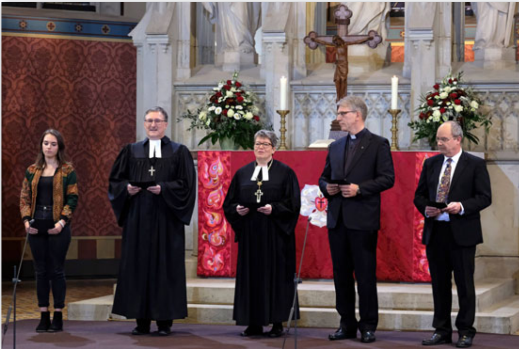
Abb. 8 Evangelischer Festgottesdienst in der Wittenberger Schlosskirche zur Feier des 500. Reformationsjubiläums am 31.10.2017

Margot Käßmann propagierte das Reformationsjubiläum als »Zeichen gegen den Nationalismus«; 29 ähnlich der früheren Tendenz des Nationalprotestantismus, als religiöser ›Verstärker‹ zeitgenössischer politischer Tendenzen aufzutreten, agierten hohe Funktionäre der evangelischen Kirche im Sinne des postnationalistischen Mainstreams der gegenwärtigen deutschen Gesellschaft. Angesichts dessen, dass sich viele dieser Kirchenvertreter in die Tradition der Bekennenden Kirche zu stellen pflegen, eher den linksprotestantischen Milieus zugehören und gemeinhin ein prophetisches Wächteramt gegenüber dem Staat in Anspruch nehmen, ist die offenkundige Konformitätsdynamik im Zusammenhang mit dem 500. Reformationsjubiläum bemerkenswert. Im wechselseitigen Lob der kirchlich-staatlichen Zusammenarbeit, 30 die im zweiteiligen Wittenberger Schlussakkord des 31.10.2017,