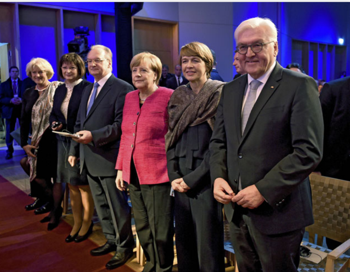
Abb. 9 Festakt zum 500. Reformationsjubi- läum mit Bundes- kanzlerin Angela Merkel und Bundes- präsident Frank- Walter Steinmeier im Stadthaus Wittenberg am 31.10.2017

bestehend aus Gottesdienst in der Schlosskirche (Abb. 8) und Festakt geladener Gäste im Stadthaus (Abb. 9), ihren Ausdruck fand, kam die unserer politischen Kultur entsprechende Spätgestalt der konstantinischen Amalgamierung von Kirche und Staat an ihr Ziel. In dieser Perspektive wurde das 500. Reformationsjubiläum als eine dem demokratischen Gesellschaftsmodell entsprechende Fortsetzung der ihre jeweilige politische Kultur – frühabsolutistischer Stände- und Territorialstaat; monarchischer Nationalstaat – spiegelnden Zentenerfeiern der Reformation inszeniert. Ob freilich das offizielle ›Logo‹ des Jubiläums, das als schwarzer Schattenriss stilisierte Cranachporträt des ›reifen‹ Luther mit Baret in den Farben ›Schwarz-Rot-Gold‹ (Abb. 10), das Ergebnis einer Kooperation staatlicher und kirchlicher Akteure oder die alleinige Entscheidung nur der ersteren war, war bisher nicht eindeutig zu klären.