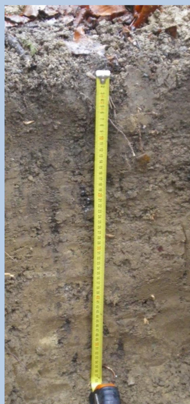
Abb.1: Bodenprofil der Tiefenlinie